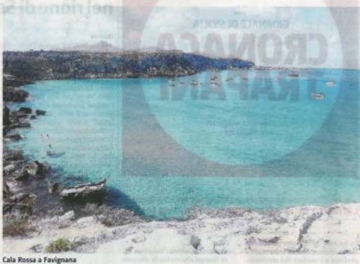
Cala Rossa a Favignana